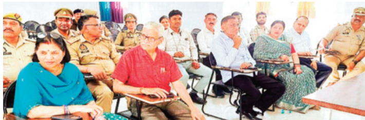
बाल कल्याण समिति को समय पर उपलब्ध कराने के निर्देश भी दिए गए। बैठक में जनपद में पंजीकृत और ललित गुमशुदगी बच्चों के मामलों तथा पॉक्सो एक्ट के अंतर्गत दर्ज अभियोगों की समीक्षा भी की गई। साथ ही जेजे एक्ट से संबंधित आदेशों और जनजागरूकता अभियान चलावने के निर्देश दिए गए। इस अवसर पर सीडब्ल्यूसी, श्रम विभाग, जिला प्रोबेशन विभाग, साइबर लाइन, प्रधान किशोर ब्याय बोर्ड, जन साहस, वन स्टॉप सेंटर सहित अन्य विभागों के अधिकारी और जनपद के सभी थानों के बाल कल्याण अधिकारी एवं कर्मचारी उपस्थित रहे।

बाल श्रम, बाल विवाह, बाल भिक्षावृत्ति की रोकथाम, लैंगिक समानता, साइबर काइम, एससी-एसटी एक्ट तथा बाल विवाह मुक्त भारत अभियान जैसे महत्वपूर्ण विषयों पर जानकारी दी गई। साथ ही नारी शक्ति, किशोर ब्याय अधिनियम 2015 में हुए नवीन संशोधन तथा पॉक्सो एक्ट से संबंधित मामलों में आवश्यक कानूनी प्रक्रियाओं पर भी प्रशिक्षण दिया गया। अधिकारियों को निर्देशित किया गया कि पॉक्सो एक्ट के तहत दर्ज मामलों की सूचना 24 घंटे के भीतर बाल कल्याण समिति (सीडब्ल्यूसी) को दी जाए तथा फार्म ई, ही और एससीआर रिपोर्ट समय से प्रेषित की जाए। इसके अलावा पॉक्सो अधिनियम को आने वाली समस्याओं पर विस्तार से चर्चा हुई। गोष्ठी में बाल गुमशुदगी,