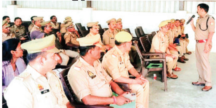
कर्मचारी निर्धारित समय से पहले अपने-अपने परीक्षा केन्द्रों पर पहुंचकर ड्यूटी ग्रहण करने को कहा। ब्रीफिंग के दौरान निर्देशित किया गया कि सभी पुलिस अधिकारी एवं